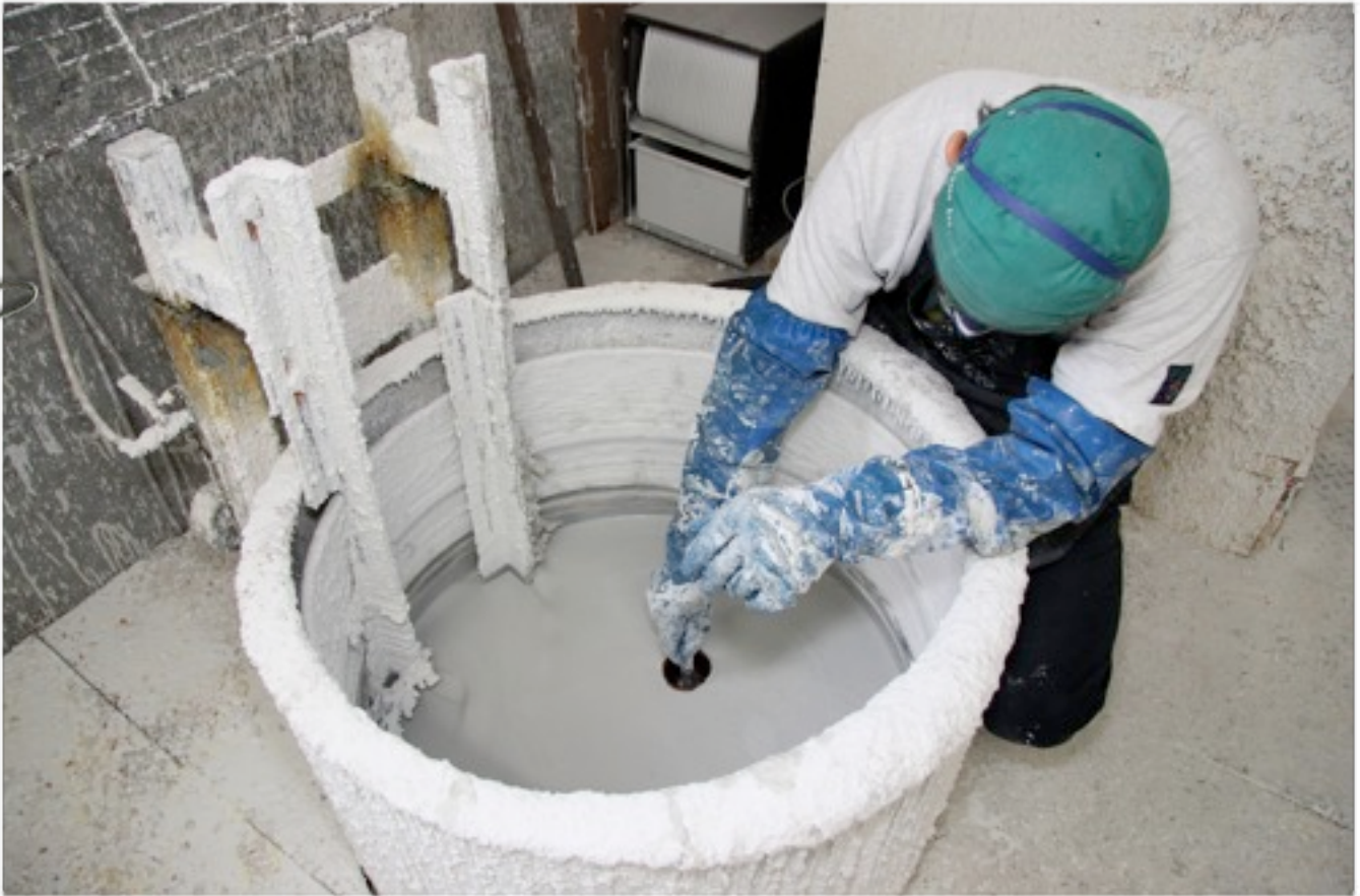
Petit bain dans la barbotine de céramique...