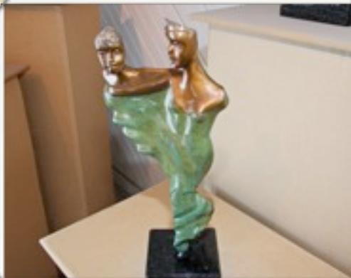
L’Autre • Bronze d’Anne Renard