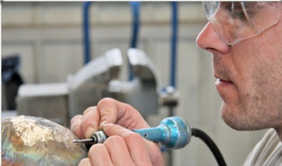
Le souci du détail...